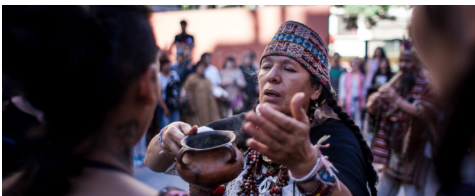
Cobertura colaborativa fuera OMC