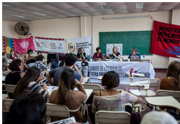
Cobertura colaborativa fuera OMC